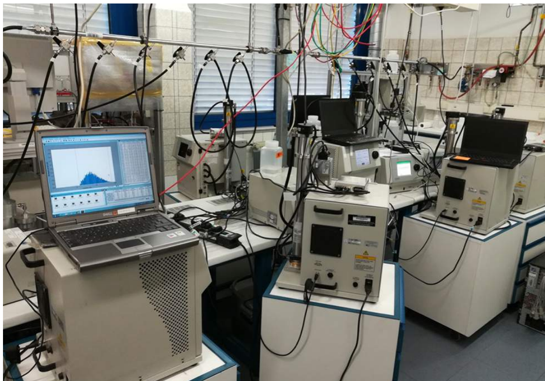
Imagen 30. Laboratorio de calibración de los instrumentos MPSS en TROPOS (Leipzig, Alemania). El primer equipo de la izquierda corresponde al CIEMAT.